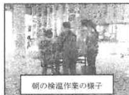
朝の検温作業の様子

新型コロナウイルス感染症が全体的な拡がりを見せる中、校内における日々の消毒及び検温作業を強化し、児童の安全・安心の確保並びに教職員の授業時間を確保することを目的として、「校内消毒及び検温等支援員(保護者・地域の皆様)」11名の皆さんに、検温・マスク確認作業や学校施設の消毒作業で御支援・御協力を頂いております。作業員の皆さん、お忙しい中での日々の作業、ありがとうございます。