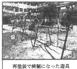
再塗装で綺麗になった遊具