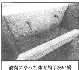
清潔になった体育館手洗い場