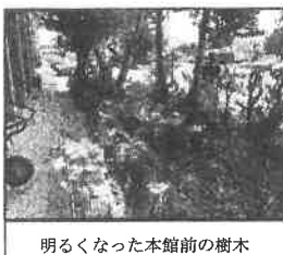
明るくなった本館前の樹木