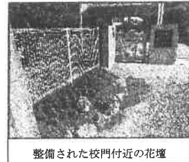
整備された校門付近の花壇