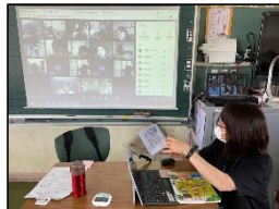
オンライン学習支援「音楽」