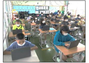
ICT 利活用 授業風景が変わります

長引く梅雨の影響で悪天気が続き、例年以上に沖縄らしい青空が待ち遠しい今日この頃、保護者の皆様はいかがお過ごしでしょうか。さて先月(6月)は、県内において新型コロナウイルス感染の患者が増加傾向にあり、その感染拡大を抑えるため、6月8日(火)～6月20日(日)まで臨時休校の措置をとらせて頂きました。そうした中、本校では子供達の「安全・安心を確保しながら、学びを止めない」を合い言葉に、「オンライン(同時双方型)学習支援」を実施いたしました。その際、保護者様におかれましては、子供達の安全・安心な登校や、御家庭のインターネット環境等を御提供頂きました。誠にありがとうございました。