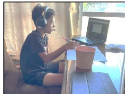
自宅で学習に励む児童