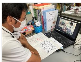
職員室から問題を読み上げる校長

小学校では、1学年で80字、第2学年で160字、第3学年で200字、第4学年で202字、第5学年で193字、第6学年で191字、1年生から6年生までに合計1,026字の漢字を学習します。