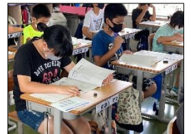
難解な調査問題に取り組む6年生

5月27日(木)、本校児童の学力の実態を把握し、今後の学習指導へ生かすことを目的に、6年生を対象とした全国学力調査(国語・算数)が実施されました。