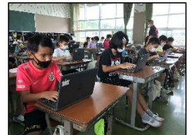
オンライン学習のふりかえり