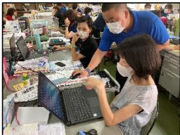
クロムブック活用 教職員研修

今後は、保護者の皆様からの御意見等を生かし、日常の授業でクロムブックをさらに効果的に利活用する等、GIGA スクール構想をより推進させ、子供達の学力と成長の保障に努めてまいります。