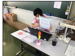
オンライン学習支援「算数」