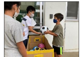
ボール貸出し担当は体育委員会です

子供達の「生きる力(知育・徳育・体育)」を育むことは、学校教育の大きな務めです。今回は、「体育の充実」へ向けて、縄跳び、各種ボール、ドッジボールコート、そしてサッカーゴールを準備・整備しました。