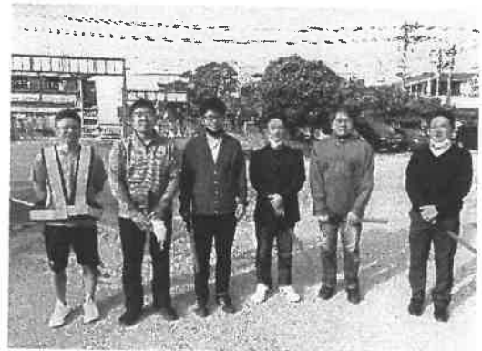
卒業式駐車場案内