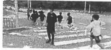
クリスマス交通安全見守り隊 令和3年12月24日