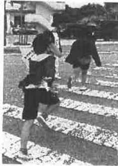
地震・津波避難訓練 令和3年10月10日