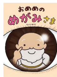
『おめめのめがみさま』