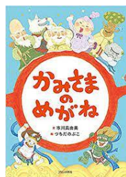
『かみさまのめがね』

10日は10日は目の愛護デーです。 暗いところで本を読んでいませんか？ 集中するのはとてもすばらしいですが、 寝ながら本を読んでいませんか？ 明るいところで、正しい姿勢で、 読んでくださいね