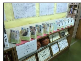
校長室前に並べられた伝記と童話

秋は、スポーツの秋・芸術の秋・収穫の秋、そして「読書の秋」と言われています。本校では、9月27日から「読書旬間」がスタートしており、子供達にはこの2週間の様々な取組(校長室の前では「10冊の魅力」ある本を紹介しています。※写真参照)を通して、これまで以上に読書に親しみ、頭の中でいろいろと感じたり、想像したりする等の「考える力」を身につけて欲しいと思います。さらに、読書は正しい日本語、美しい日本語という点でも、とても素晴らしい言葉や文章を学ぶことができます。