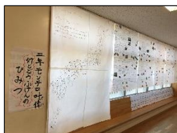
モンテロ叶偉さんの作品

生き物や自然の観察、三味線、ゲーム、貯金箱、小物づくり等々、1年生から6年生までの甲乙つけがたい、すばらしい作品に驚きと同時に感動を覚えました。